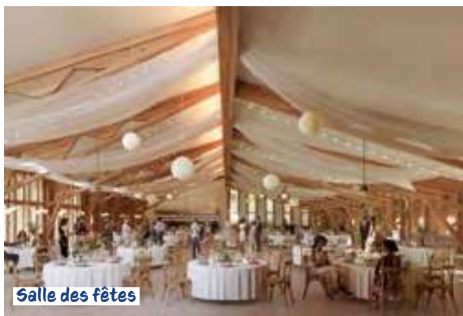
Salle des fêtes