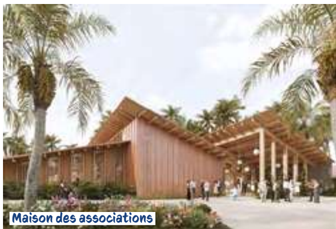
Maison des associations